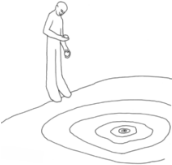
Abbildung 2 Wellenausbreitung in einem Teich.