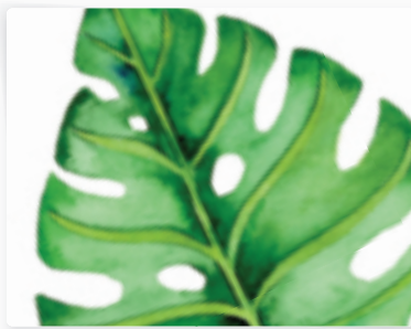
82 | Monstera