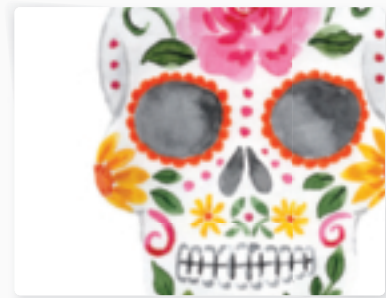
78 | Mexikanische Calavera