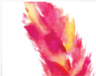
58 | Feder