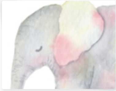
62 | Elefant