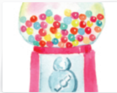
76 | Kaugummiautomat