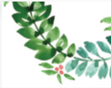
44 | Blätterkranz