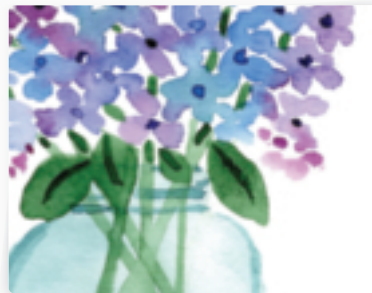
34 | Blumen im Glas