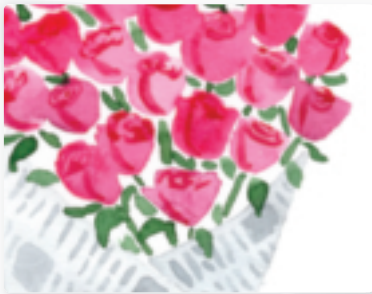
26 | Rosen in Zeitungspapier