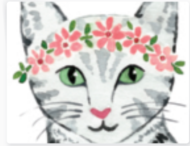
66 | Katze