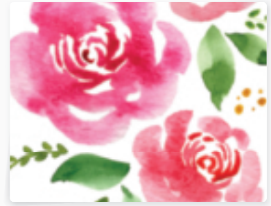
42 | Rosenblüten