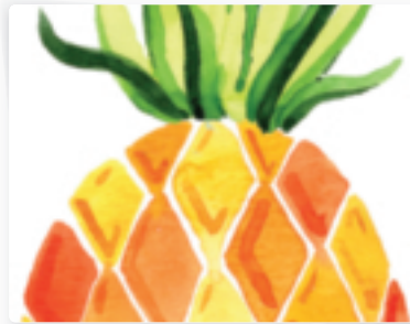
28 | Ananas