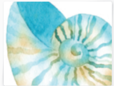
60 | Schneckenhaus