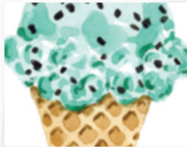
46 | Eis in der Waffel