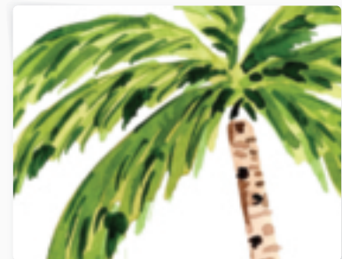
36 | Palme