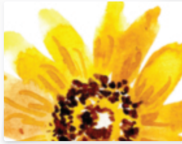
40 | Sonnenblume