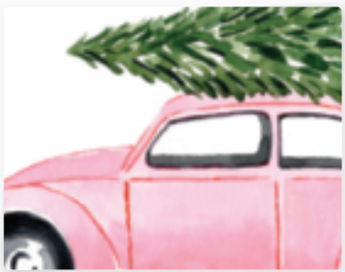
80 | Merry Christmas