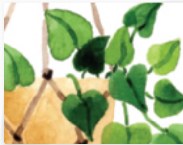
52 | Blumenampel