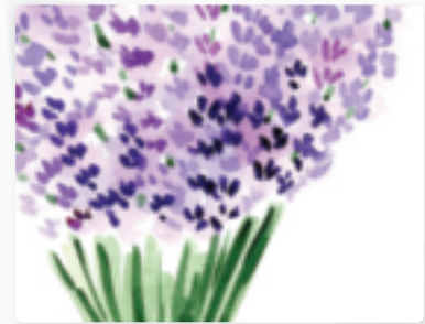
30 | Lavendel