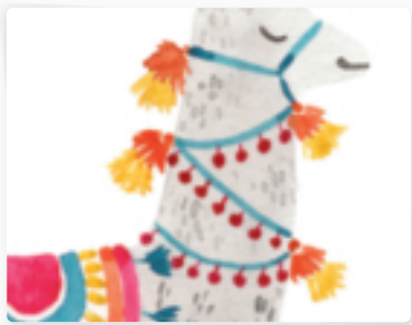
74 | Lama