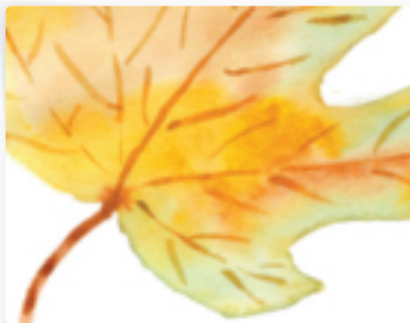
32 | Herbstlaub