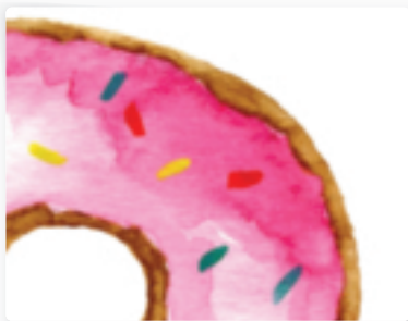
56 | Donut