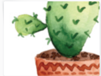
48 | Kaktus im Topf