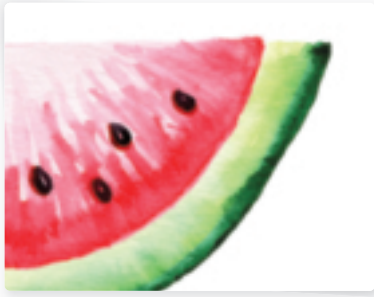
38 | Wassermelone